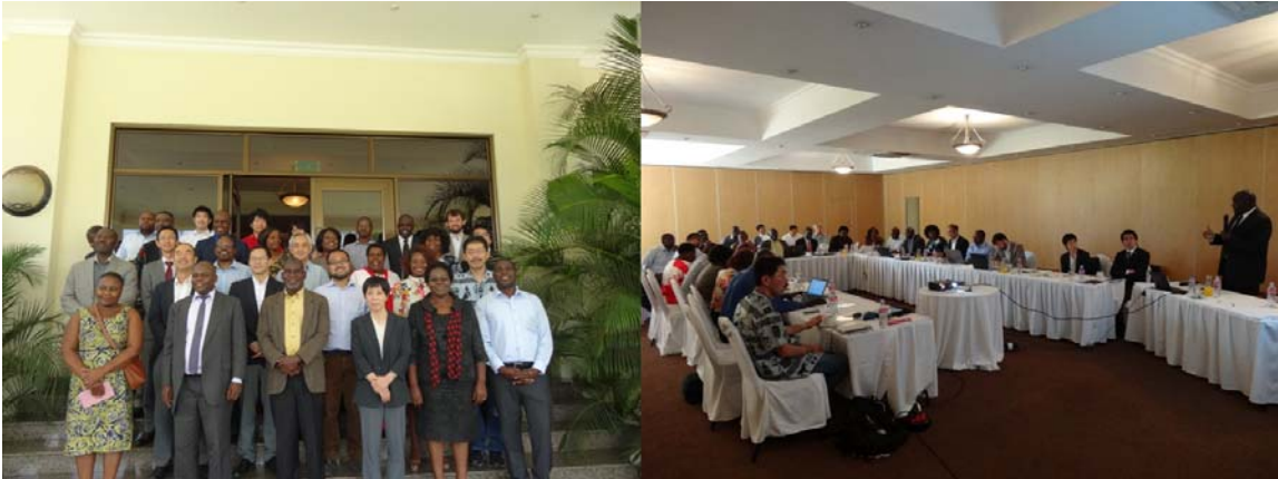
The 5 th Lusaka Workshop in Lusaka, Zambia on 8 th February 2016