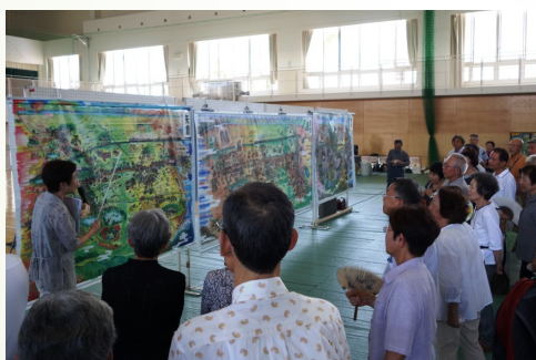
絵解きの様子（滋賀）