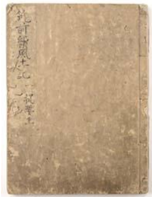
図1 『筑前国続風土記』