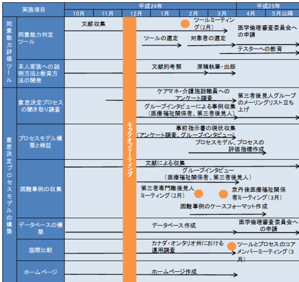
図2 平成24年度のプロジェクト全体の進捗状況の概要

平成24年度にメンバーで行った議論の結果、多くの事例に適用可能な一般的プロセスモデル以外に、困難事例への対応に関してまとめた事例集作成が必要であることで意見が一致した。そこで、文献、及び参加メンバーから意思決定プロセスに困難を生じた事例を収集していく予定である。平成24年度は、第三者専門職後見人及び医療福祉関係者がそれぞれ経験する困難事例を集めて症例の特徴を抽出するためのケースフォーマットを作成した。